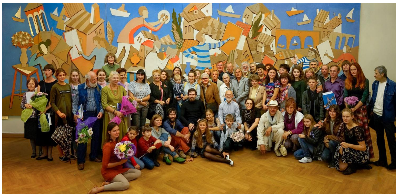
После открытия выставки. Учащиеся, преподаватели и выпускники разных лет. 2016 год.