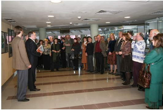
Дом русского зарубежья им. А.И.Солженицына