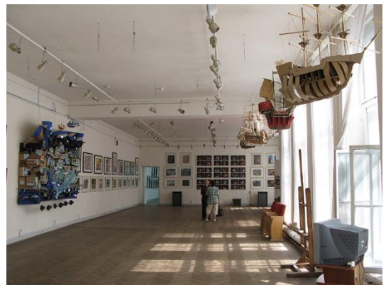
Санкт-Петербург, Выставочные залы СХ. ул. Большая Морская, 38

2012 – Национальная Академия изобразительного искусства и архитектуры (Киев);